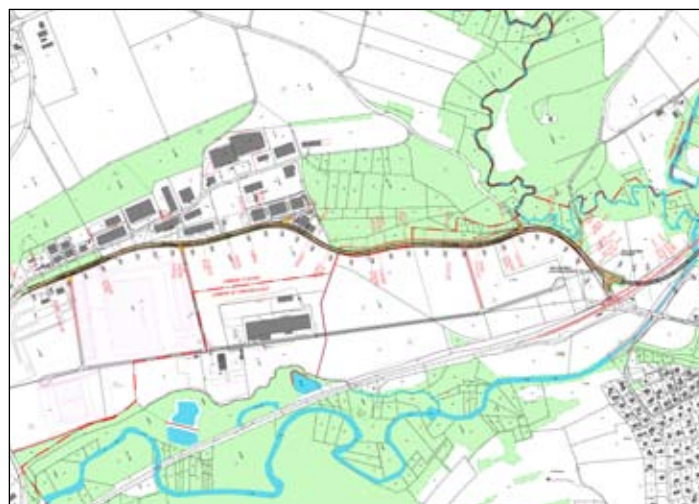
Segment de la RC 177 près de Vufflens-la-Ville.

Le site de Vufflens/Aclens a été choisi comme pôle de développement logistique d'importance cantonale.