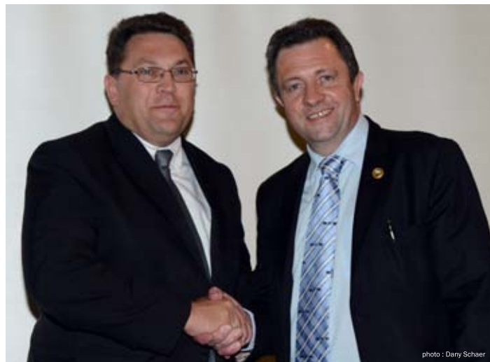
Le président sortant Laurent Wehrli cède sa place à Jacques Nicolet.

Je me battrais toujours pour défendre notre liberté.